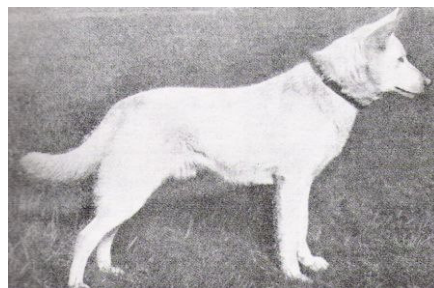
BERNO VON DER SEEWIESE